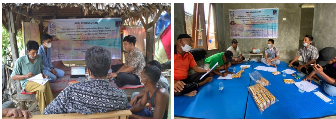
Gambar 1. Kegiatan penyuluhan penyampaian materi penanganan hasil tangkapan

Hasil rekapitulasi evaluasi aspek pengetahuan penanganan hasil tangkapan, dari evaluasi awal diperoleh nilai rata-rata 27 dan evaluasi akhir rata-rata 91 atau naik 64%. Rincian nilai evaluasi perorangan anggota kelompok, dapat dilihat pada Gambar 2.