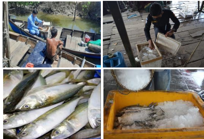
Gambar 3. Aksi penyuluhan materi kemunduran mutu ikan dengan penilaian organoleptic

Es yang digunakan tidak dari pabrik es, melainkan es tersebut buatan sendiri. Selain hemat biaya dan juga para nelayan bisa lebih cepat mendapatkan es tersebut. Di Kecamatan Babalan sendiri tidak memiliki pabrik es, melainkan pabrik es hanya ada pada pusat kota yang berjarak 1-2 jam dalam perjalanan. Air yang digunakan pada es buatan yaitu berasal dari air sumur yang tidak dimasak (mentah). Penyimpanan ikan segar dengan menggunakan es atau sistem pendinginan yang lain memiliki kemampuan yang terbatas untuk menjaga kesegaran ikan, biasanya 10–14 hari.