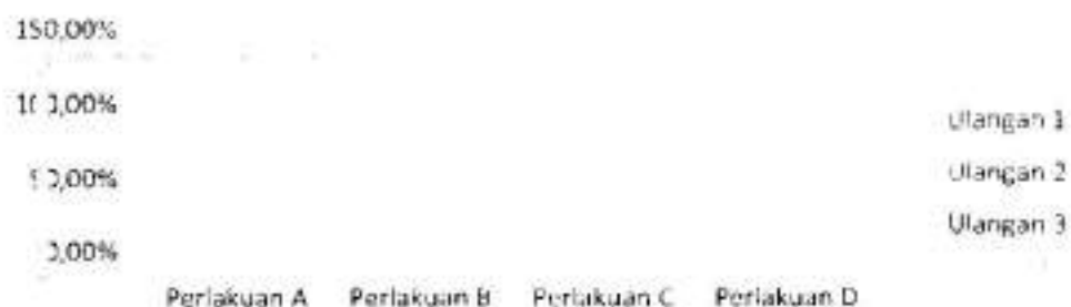
Gambar 3. Grafik Sintasan ikan lele

Sintasan adalah prosentase jumlah ikan yang masih hidup pada akhir pemeliharaan terhadap jumlah awal penebaran. Berdasarkan Gambar 3 dapat diketahui bahwa Perlakuan C dan D menghasilkan sintasan yang lebih tinggi dibanding perlakuan A dan B. Perlakuan D mempunyai nilai rata-rata kelangsungan hidup yang tertinggi dibanding perlakuan perlakuan C, B dan A. Jadi meskipun pertumbuhan panjang dan berat pada perlakuan D hampir sama dengan perlakuan C, namun perlakuan D menghasilkan SR yang tertinggi.