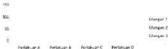
Gambar 2. Grafik hasil pengamatan pertumbuhan berat (gram) ikan lele pada akhir penelitian

Berdasarkan hasil pengukuran pertumbuhan berat yang merupakan selisih berat pada akhir penelitian dan awal penelitian, diketahui bahwa perlakuan C dan D menghasilkan pertumbuhan berat yang berbeda terhadap perlakuan A dan B (Gambar 2).