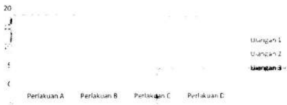
Gambar 1. Grafik hasil pengamatan pertumbuhan panjang (cm) ikan lele pada akhir penelitian

Data hasil pengukuran pertumbuhan panjang pada akhir penelitian maka diperoleh hasil sebagaimana tertera pada Gambar 1. Berdasarkan Gambar 1 dapat diketahui bahwa Perlakuan C dan D menghasilkan rata-rata pertumbuhan panjang yang lebih tinggi dibanding perlakuan A dan B. Hal ini diduga bahwa probiotik yang diaplikasikan pada pakan memberikan pengaruh daya cerna ikan terhadap pakan sehingga pakan yang dikonsumsi oleh ikan dapat optimal diserap oleh dinding pencernaannya serta menghasilkan pertumbuhan panjang yang optimal. Perlakuan B menghasilkan rata-rata pertumbuhan panjang yang lebih rendah dibanding perlakuan A, karena ketersediaan nutrisi yang lebih banyak pada perlakuan A dibanding perlakuan B, terkait jumlah data ikan yang diukur.