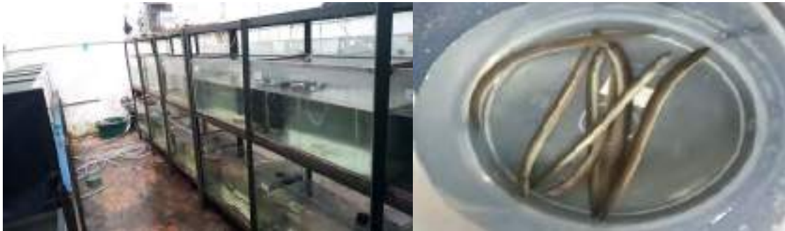
Gambar 1 Susunan rak akuarium dan bibit sidat

Figure 1. Aquarium rack arrangement and eel seeds