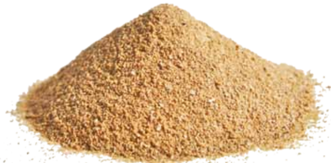
Gambar 1. Produk hasil fermentasi tepung bungkil kedelai (FSBM) yang dilakukan dengan menggunakan kultur Tunggal Lactic acid bacteria

Dalam beberapa dekade terakhir, industri akuakultur mengalami pertumbuhan pesat yang diiringi dengan peningkatan kebutuhan pakan yang berkualitas. Salah satu tantangan utama dalam formulasi pakan adalah ketergantungan terhadap tepung ikan (fish meal) sebagai sumber protein utama, dimana dengan pasokan yang fluktuatif, serta permintaan yang tinggi, menjadikan harga tepung ikan terus mengalami peningkatan. Sebagai akibatnya, tentu harga pakan akan terus meningkat sehingga mendorong pencarian bahan baku alternatif yang lebih berkelanjutan. Bungkil kedelai (soybean meal, SBM) telah lama digunakan sebagai substitusi karena ketersediaannya yang tinggi dan kandungan proteinnya yang relatif baik. Namun, penggunaan SBM konvensional dalam pakan ikan dan udang masih menghadapi kendala, terutama terkait keberadaan faktor anti-nutrisi (anti-nutritional factors/ANFs) seperti trypsin inhibitor, oligosakarida, serta protein antigenik yang dapat mengganggu pencernaan dan kesehatan saluran pencernaan.