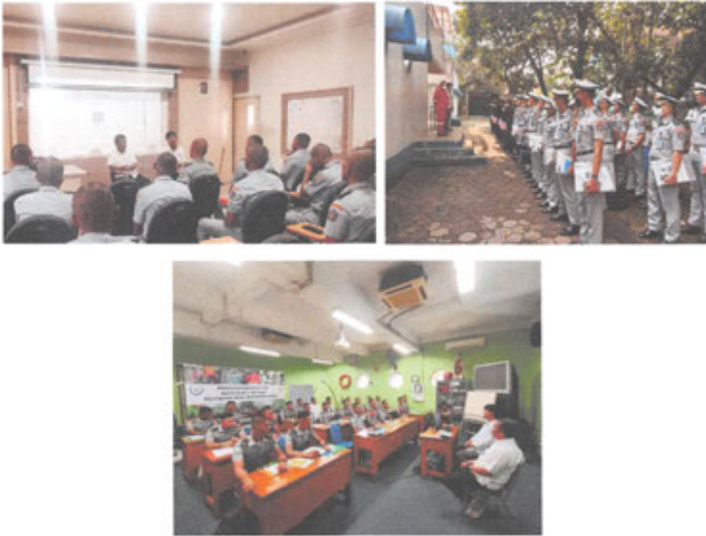
Gambar 3. Sosialisasi standar prosedur pelayanan dilaksanakan kepada stakeholder pengguna layanan