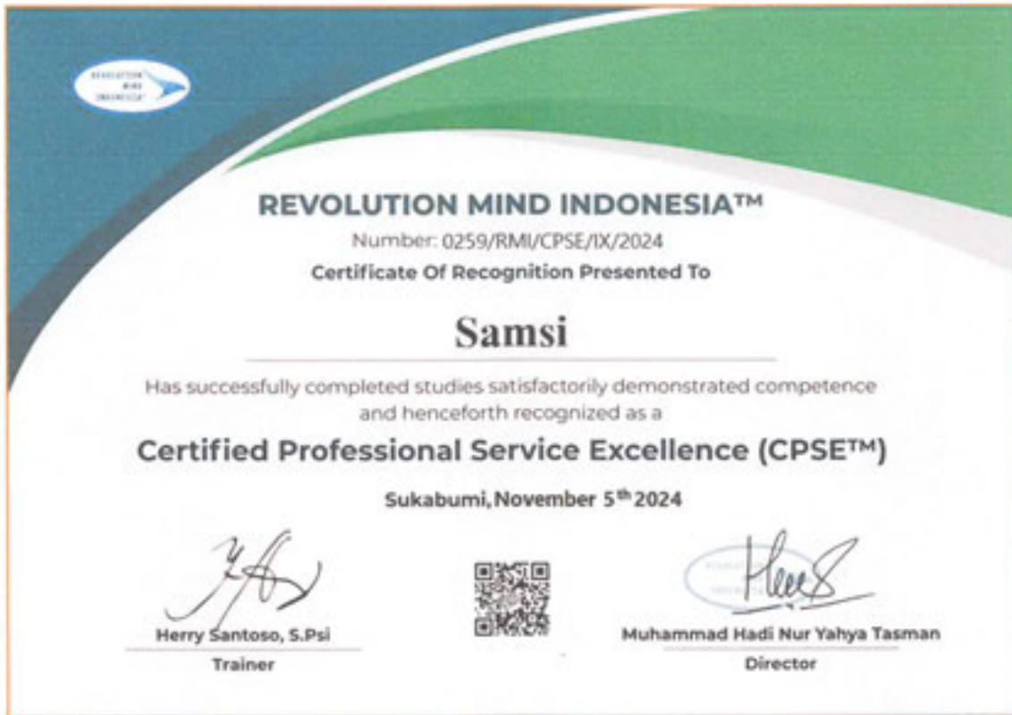
Gambar 1. Certified Profesional Service Excellence a.n Samsi