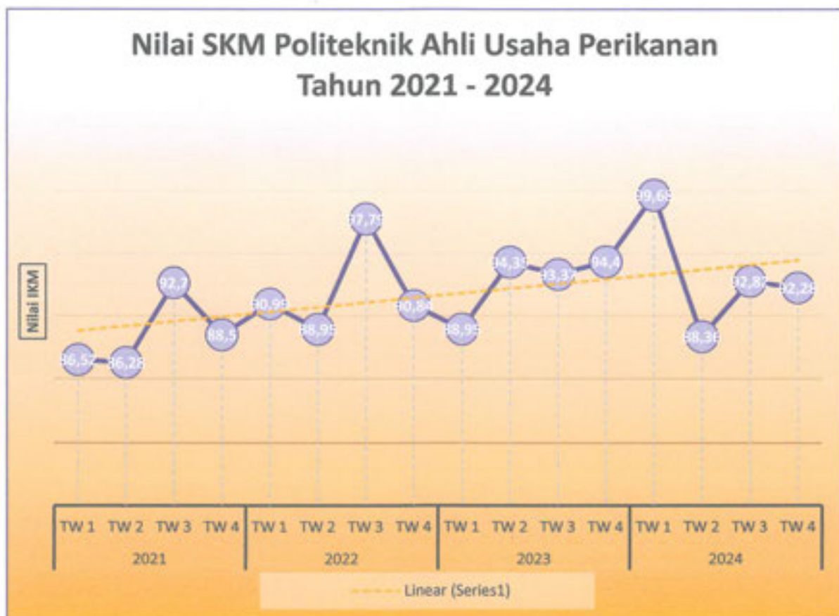
Gambar 3. Grafik Tren Nilai SKM Politeknik AUP Tahun 2021 s.d 2024

survei secara periodik dan berkesinambungan. Hasil analisa survei dipergunakan untuk melakukan evaluasi kepuasan masyarakat terhadap layanan yang diberikan, sebagai bahan pengambilan kebijakan terkait pelayanan publik serta melihat kecenderungan (tren) layanan publik yang telah diberikan penyelenggara kepada masyarakat serta kinerja dari penyelenggara pelayanan publik. Tren tingkat kepuasan penerima layanan Politeknik Ahli Usaha Perikanan dapat dilihat melalui grafik berikut: