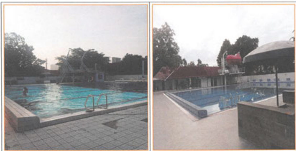
Gambar 2. Renovasi Sarana Kolam Renang Latih sebelum dan sesudah