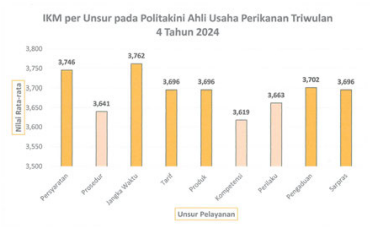
Gambar 2. Grafik Nilai SKM Per Unsur