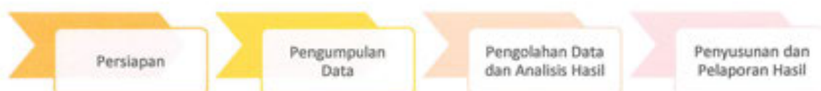
Gambar 1. Alur Pelaksanaan Survei Kepuasan Masyarakat

Survei dilakukan secara periodik dengan jangka waktu (periode) tertentu yaitu 3 (tiga) Bulan atau per Triwulan sekali pada tanggal 1 Oktober sampai dengan 31 Desember Tahun 2024. Penyusunan indeks kepuasan masyarakat dengan rincian sebagai berikut: